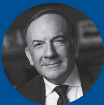
ÉDITO DE PIERRE GATTAZ

« Jamais la mondialisation n'a autant été mise au banc des accusés comme une cause des difficultés identitaires, sociales et économiques que traverse notre pays (déindustrialisation, fuite des cerveaux, chômage de masse...).