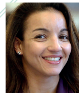
Sarah Ourahmoune Boxer Inside Conférences, ateliers boxe et performance