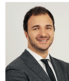
Jules Julian JDG Assurances Assurances entreprises