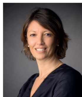
Natacha Pauillac Pauillac Traiteur Restauration