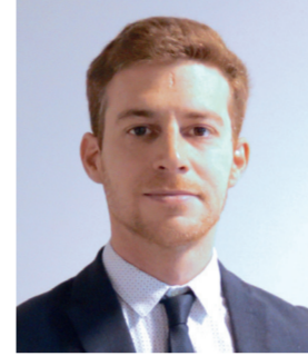
Bastien Brunis Agence Solicom Communication