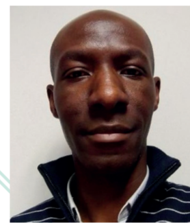
Nel-Yvon Galiu Regeltex Industrie, gants isolants