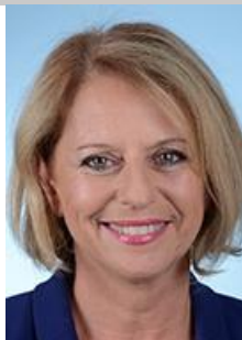
Brigitte Bourguignon (LREM – Pas de Calais, 6 ème )

Native du Pas-de-Calais, Brigitte Bourguignon devient en 2001 adjointe au Maire de Boulogne-sur-Mer chargée de la santé, de la petite enfance et de l'accessibilité de la ville aux personnes handicapées. Nommée Secrétaire nationale aux Sports du Parti socialiste en novembre 2008, elle rejoint les bancs de l'Assemblée nationale en 2012, où elle représente la 6 ème circonscription du Pas-de-Calais. Elle poursuit sa carrière politique à la mairie de Marquise, où elle est conseillère municipale de l'opposition depuis 2014. Alors qu'elle soutient Benoît Hamon au premier tour de l'élection présidentielle, elle rejoint Emmanuel Macron durant l'entre-deux-tours et obtient l'investiture En Marche ! pour les élections législatives de 2017. Elle est ainsi réélue députée de la 6 ème circonscription du Pas-de-Calais sous les couleurs de La République en Marche .