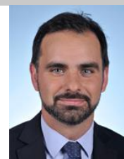
Laurent Saint-Martin (LREM – Val-de- Marne, 3 ème )