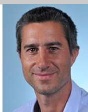
François Ruffin (FI – Somme, 1 ère )