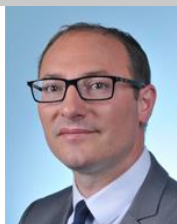
Denis Masségli (LREM – Maine-et-Loire, 5 ème )