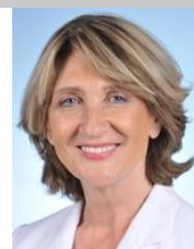
Elisabeth Toutut-Picard (LREM – Haute-Garonne, 7 ème )