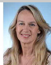
Constance Le Grip (LR – Hauts-de-Seine, 6 ème )