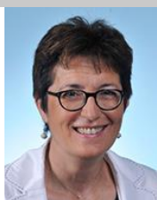
Sylvie Charrière (LREM – Seine-Saint-Denis, 8 ème )