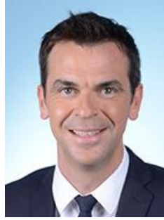
Olivier Véran (LREM – Isère, 1 ère )

Praticien hospitalier, Olivier Veran commence sa carrière en qualité de neurologue au CHU de Grenoble, avant d'obtenir un diplôme en gestion et politique de santé à Sciences Po Paris. En 2012, il s'engage en politique en militant au sein du Parti socialiste à l'occasion de la campagne présidentielle. Suppléant de Geneviève Fioraso élue députée de l'Isère en 2012, il prend son siège à l'Assemblée lorsque celle-ci est nommée ministre de l'Enseignement supérieur et de la recherche. Il est l'un des principaux artisans de la Loi Santé défendue par Marisol Touraine en 2015 et dont il a été le rapporteur. Porte-parole du président sortant de la région Rhône-Alpes Jean-Jack Queyranne lors de la campagne des élections régionales de 2015, Olivier Veran siège également comme conseiller régional en Auvergne/Rhône-Alpes depuis 2016. La même année, il rejoint le mouvement En Marche ! et apporte son soutien à Emmanuel Macron, dont il devient le référent santé pendant la campagne présidentielle. Il est élu député de la 1 ère circonscription de l'Isère sous l'étiquette La République en Marche en juin 2017.