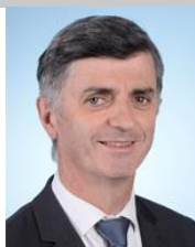
Jacques Maire (LREM – Hauts-de-Seine, 8 ème )