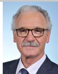
Didier Paris (LREM – Côte-d'Or, 5 ème )