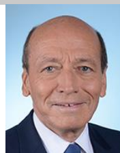
Michel Herbillon (LR – Val-de-Marne, 8 ème )