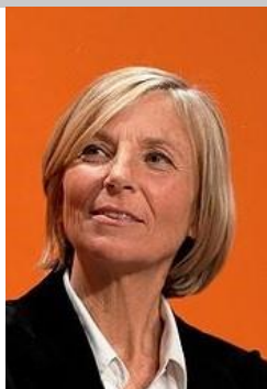
Marielle de Sarnez (MoDem - Paris, 11 ème )