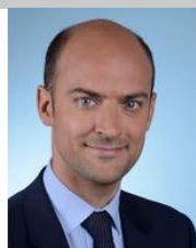
Jean-Noël Barrot (MoDem – Yvelines, 2 ème )