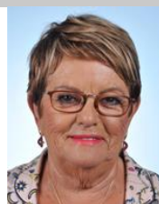
Monique Iborra (LREM – Haute-Garonne, 6 ème )