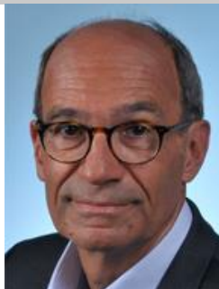
Eric Woerth (LR – Oise, 4 ème )

Diplômé d'HEC et de Sciences Po Paris, Éric Woerth est un spécialiste en audit des collectivités locales et des administrations publiques. D'abord encarté au RPR, il devient conseiller régional de Picardie en 1981 puis Vice-Président du conseil régional lors de sa réélection en 1992. Il est élu maire de Chantilly sans discontinuité depuis 1995, année où Jacques Chirac le nomme directeur de sa campagne présidentielle. De 1995 à 1997, il devient conseiller parlementaire du Premier ministre Alain Juppé, dont il est resté proche. Il fonde en 2002 le Club de la boussole, qui regroupe 38 députés UMP « réformistes » revendiquant leur fidélité au président de la République Jacques Chirac et au Premier ministre Jean-Pierre Raffarin. Entre 2004 et 2010, il exerce successivement les fonctions de Secrétaire d'État de la réforme de l'État, ministre du Budget, des Comptes publics et de la Fonction publique, et ministre du Travail, de la Solidarité et de la Fonction publique. Entre temps, il rejoint les Réformateurs, le courant libéral de l'UMP structuré autour d'Hervé Novelli.