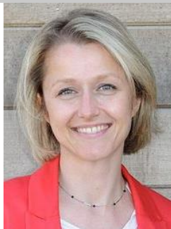
Barbara Pompili (LREM – Somme, 2 ème )