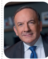
Pierre Gattaz, Président du Mouvement des entreprises de France - MEDEF

« L'entrepreneuriat est une solution pour répondre au défi du plein-emploi. Il est porteur de valeurs et de développement pour notre pays. Le MEDEF s'est engagé à accompagner cette dynamique avec l'ambition de doubler le nombre d'entreprises en France. »